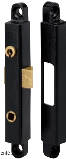
Modèle représenté : droite tirant