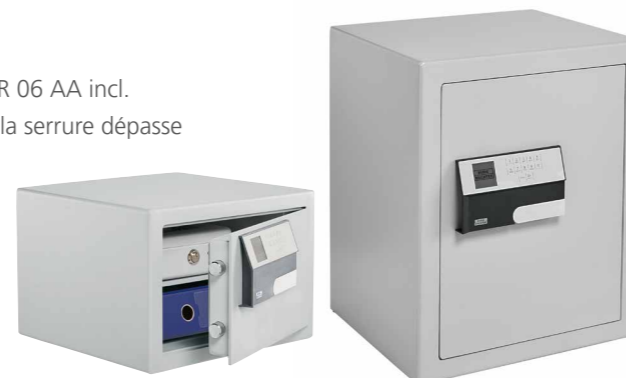
C 310 E