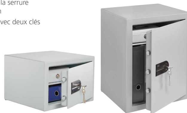
C 310 K