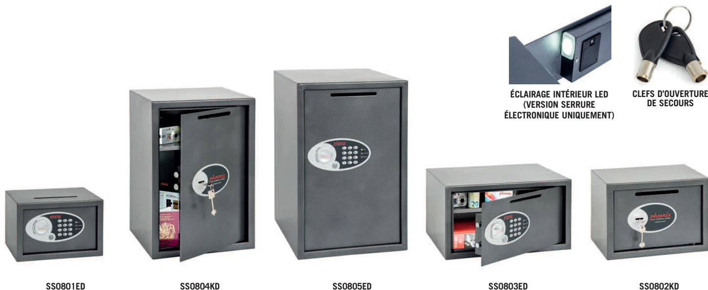
ÉCLAIRAGE INTÉRIEUR LED (VERSION SERRURE ÉLECTRONIQUE UNIQUEMENT)