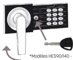
*Modèles HES90/140 - HED25/40

Para las gamas HES y HED, quite la tapadera de la cerradura e introduzca la llave suministrada. Gire la llave hacia el sentido indicado según modelo. Para abrir la caja fuerte gire el pomo hacia el sentido indicado según modelo.