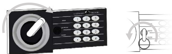
*Modèles HES15 / 25 / 30

Après avoir ouvert la porte, installer les 4 piles AA dans le logement prévu, à l'intérieur du coffre.