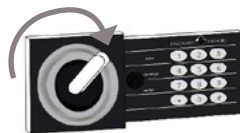
*Modèles HES15 /25 / 30