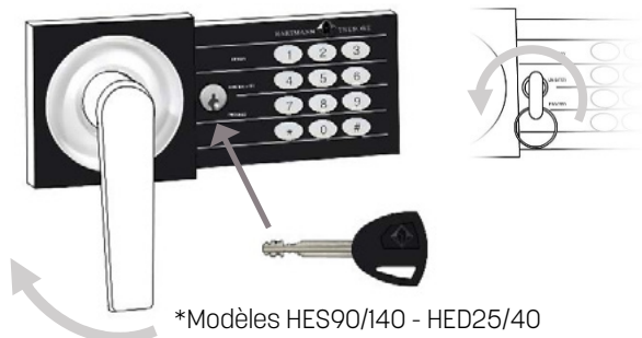
*Modèles HES90/140 - HED25/40

Pour les gammes HES et HED, ôter la Capsule plastique qui occulte la serrure. Insérer la clé à côté de l'indication « LOW BATTERY » sur le clavier et tourner dans le sens indiqué selon modèle de serrure. Tourner ensuite la poignée dans le sens indiqué ci-dessous.