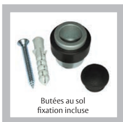
Butées au sol fixation incluse