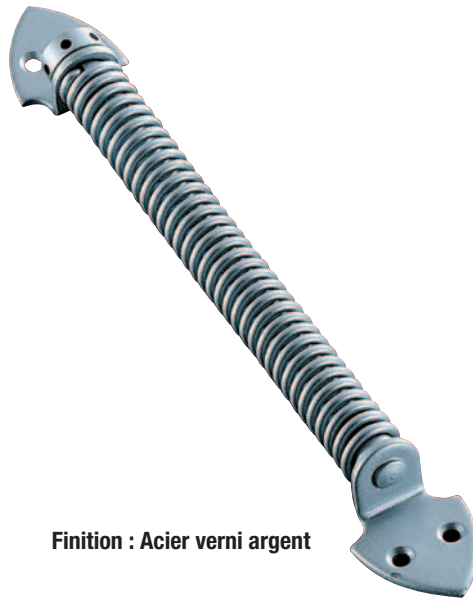
Finition : Acier verni argent